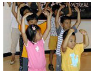
加拿大蒙特利尔明慧学校