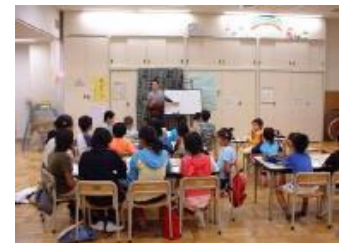
日本东京明慧学校