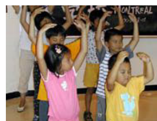
加拿大蒙特利尔明慧学校