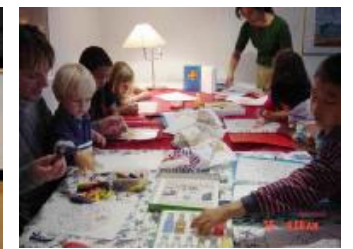
瑞典斯德哥尔摩明慧学校