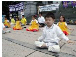
加拿大温哥华明慧学校