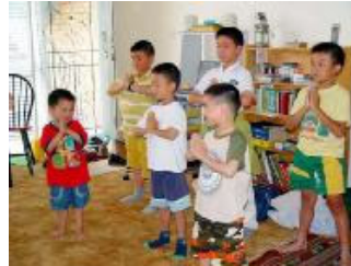
澳洲墨尔本明慧学校