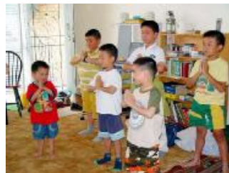
澳洲墨尔本明慧学校