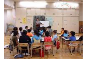
日本东京明慧学校