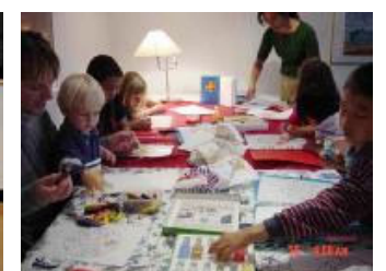
瑞典斯德哥尔摩明慧学校