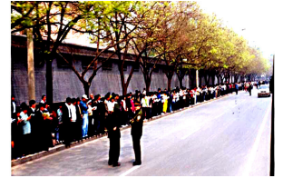
法轮功学员没有阻塞交通，静静的站立等候十几个小时，离开时把环境清理的干干净净。

是在北京市府右街的国务院信访办，而信访办的位置就在中南海的西门，如果信访办在其它地方，法轮功学员根本就不会去中南海。把 4.25 上访称作“围攻中南海”事件，本身就是有意渲染的。再说，有这么“围攻”的吗？