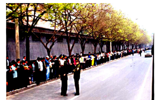
法轮功学员没有阻塞交通，静静的站立等候十几个小时，离开时把环境清理的干干净净。

是在北京市府右街的国务院信访办，而信访办的位置就在中南海的西门，如果信访办在其它地方，法轮功学员根本就不会去中南海。把 4.25 上访称作“围攻中南海”事件，本身就是有意渲染的。再说，有这么“围攻”的吗？