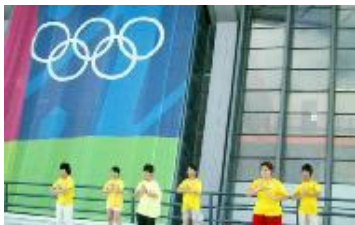
在奥运场地附近展示功法

希腊是自 911 恐怖事件发生以来首次主办奥运会的国家，为了保障奥运顺利举行，希腊警方规定奥运期间任何团体不得在雅典举行大规模的游行和集会。而法轮功作为唯一获准在雅典游行的团体，可以称得上是作为西方文明摇篮的希腊对正统东方文化的推崇和特殊礼遇。