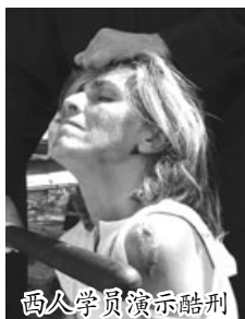
西人学员演示酷刑

贾庆林在1999年-2002年任北京市委书记和国家政策委员会书记期间，紧跟江泽民迫害法轮功，推动全市的镇压。其任职期间是北京对法轮功学员迫害最疯狂、残酷的时期。北京工商大学青年教师赵昕，北京法轮功学员梅玉兰、龚宝华、张淑琪等都在这期间被迫害致死，天安门“自焚”伪案也在此期间发生，上百万依法和平上访的法轮功学员被非法关押并被送进各地劳教所。贾是被“追查迫害法轮功国际组织”追查的11个直接参与迫害法轮功学员的中共中央官员之一。