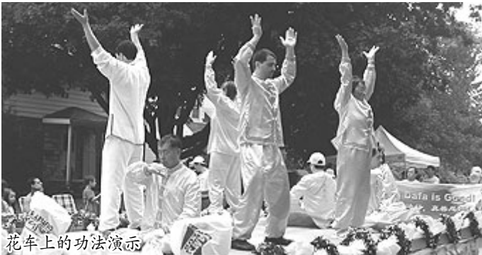
花车上的功法演示