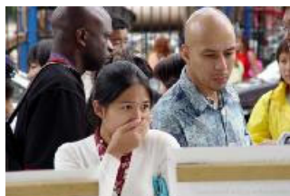
从未见过如此的残酷