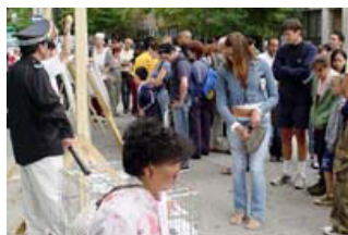
在南街码头的反酷刑展