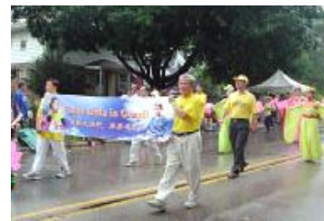
法轮功学员游行队伍

“这是法轮功，真好看。”更多的居民向学员们招手致意，并索取真象资料。在经过主席台时，学员们展示了五套功法和优美的莲花舞蹈，主持人同时介绍到：“这就是法轮功，也叫法轮大法，他是一种来自中国古老的功法，并修炼真，善，忍。多么美好啊！法轮功在全世界六十多个国家洪传，有一亿人修炼，在瑞柏市也有法轮功修炼者，感谢你们的到来，真是太美了！”