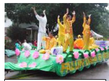
法轮功学员们在花车上表演五套功法