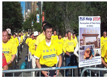
联合国广场前大型集体炼功