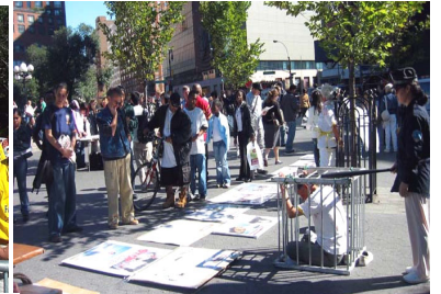
联合国广场上的反酷刑展示