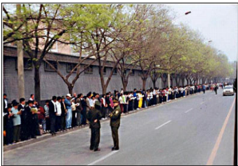
上访学员安静祥和，警察闲聊天

法轮功学员们在街两边的人行道上安静祥和地排着队，边看书边等待着信访。后来，朱熔基总理亲自接见了学员代表，下天津公安局放人，并重申了国家不会干涉群众炼功的政策。当晚 10 点左右，学员们悄然离去。整个过程，平静祥和，秩序井然。上万人离开后，地上没有留下一片纸屑，连警察扔在地上的烟头都拣得干干净净。当时在场的警察都感动地说：“什么是‘道德’？这就是道德！”