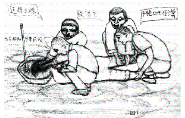
示意图：把头压入水盆灌水

洗脑班的帮教们经常揪起我的头发，使双脚近乎离地后猛速地将我的头在空中旋转，这样我被它们转得昏昏沉沉之时头发也被抓掉一部分，但当脚跟刚着地，气还没喘过来之际，又把我的头压入厕所盆里灌水[见示意图]，在水中我因不能呼气造成多次窒息昏迷过去。他们还在我的鼻孔和眼睛里滴入辣椒水，烈酒或涂上芥末；用一根很粗的针往我身上、四肢乱扎，皮肉被扎破后鲜血粘在衣服里，滴在地上。