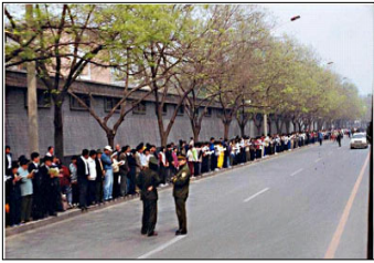
上访学员安静祥和，警察闲聊天

法轮功学员们在街两边的人行道上安静祥和地排着队，边看书边等待着信访。后来，朱熔基总理亲自接见了学员代表，下天津公安局放人，并重申了国家不会干涉群众炼功的政策。当晚 10 点左右，学员们悄然离去。整个过程，平静祥和，秩序井然。上万人离开后，地上没有留下一片纸屑，连警察扔在地上的烟头都拣得干干净净。当时在场的警察都感动地说：“什么是‘道德’？这就是道德！”