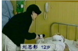
记者的装扮足以导致“自焚者” 感染死亡