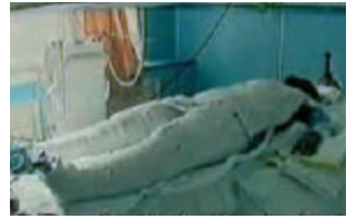
《焦点访谈》中的“自焚者” 却被包裹得严密