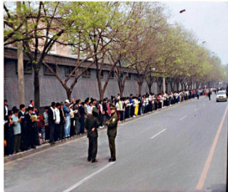
上访学员安静祥和，警察没事

新颖，是大连市妇产医院的护士。我们从 1995、1996 年开始修炼法轮大法，按照《转法轮》一书中的道理严格要求自己，为别人着想，工作一丝不苟。在短时间内我们就体会到了健康状况的改善和道德水平的提升。很自然的，我们的工作得到单位的肯定，我们的家庭也和睦美满。亲身的修炼实践使我们认识到法轮大法是一部对个人、对家庭、而且对整个社会都非常有益的高德大法，因为他能使人们得到百万资产都买不来的健康、高尚和真正的幸福。