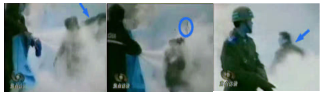
1, 刘头部受重击 2, 击打后飞出的重物 3, 打击者仍保持用力姿势

由中央电视台“焦点访谈”播出的2001年1月天安门广场“自焚”事件录像的慢镜头分析。从画面中可以清楚地看出，死者刘春玲不是被火烧死，而是被一重物击打脑部致死！下为《焦点访谈》中被击打而死的刘春玲镜头：