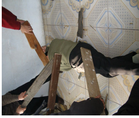
恶人们用床板暴打坚定的大法学员