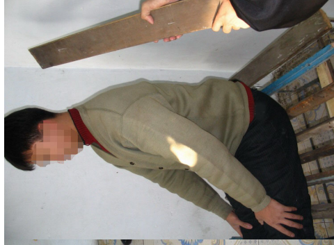
双腿伸直坐在带楞的木板上恶徒并用床板猛砍