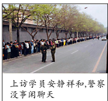
上访学员安静祥和，警察没事闲聊

伤，45 人被非法抓捕。法轮功学员要求放人，天津市政府告知北京公安部介入了此事，如果没有北京授权，被捕的学员不能释放，并示意只有去北京才能解决问题。