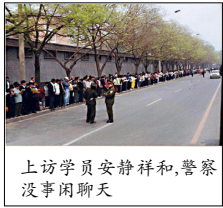
上访学员安静祥和，警察没事闲聊

伤，45 人被非法抓捕。法轮功学员要求放人，天津市政府告知北京公安部介入了此事，如果没有北京授权，被捕的学员不能释放，并示意只有去北京才能解决问题。