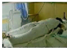
《焦点访谈》中的“自焚者”却被包裹得严密