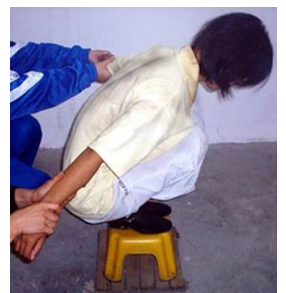
蹲：直接蹲在地上或蹲小凳、蹲图钉(头前和身体周围地上摆上图钉，蹲不住就会被扎伤)