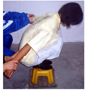
蹲：直接蹲在地上或蹲小凳、蹲图钉(头前和身体周围地上摆上图钉，蹲不住就会被扎伤)