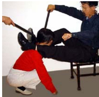
各种姿势的电棍电击