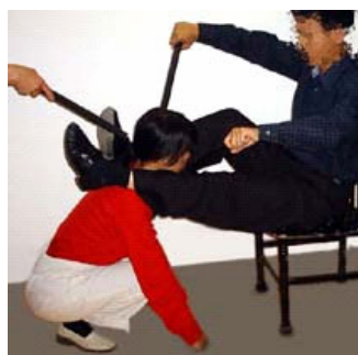
各种姿势的电棍电击