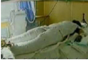
《焦点访谈》中的“自焚者”却被包裹得严密。