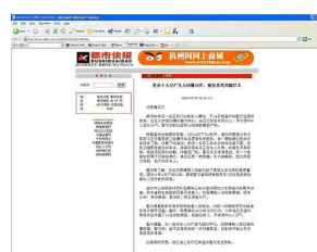
图三：都市快报网页文章 (2003-05-20 09:54:13)