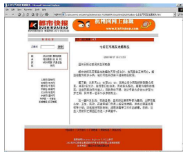
图一：都市快报网页文章 (2003-07-02 10:31:18)