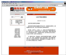
图一：都市快报网页文章 (2003-07-02 10:31:18)