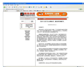
图三：都市快报网页文章 (2003-05-20 09:54:13)