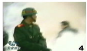
4、击打者仍保持用力姿势