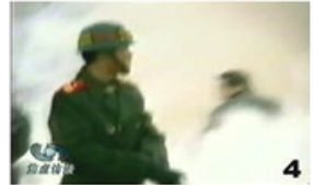
4、击打者仍保持用力姿势