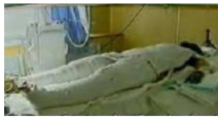
记者未穿防护服,采访无任何防护措施“烧伤者”