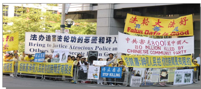
500 多位法轮功学员在胡下榻的洲际旅店前和平呼吁停止迫害。

2005年9月8日上午，胡锦涛率团在暴风雨中抵达加拿大首都渥太华。数百名法轮功学员在机场、胡下榻旅馆和总督办公室等地，打出“严惩江泽民、罗干、刘京、周永康”、“法办迫害法轮功的恶警和坏人”、“中共停止迫害法轮功”、“胡锦涛：神和人民给你的时间是有限的”等横幅和平呼停止迫害。