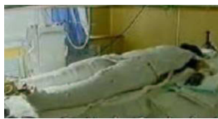
记者未穿防护服,采访无任何防护措施“烧伤者”