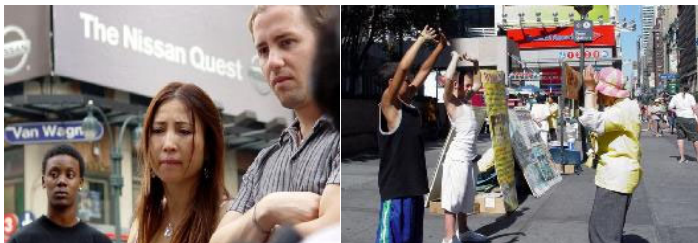
人们的脸上流露出震惊和同情