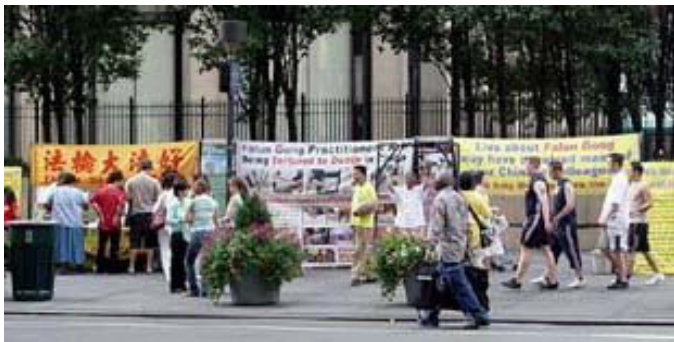
中秋佳节，讲真象、呼吁制止迫害的法轮功学员

【明慧网 2005 年 9 月 25 日】9 月 18 日周日，正值中秋佳节，在纽约曼哈顿繁忙的七大道三十三街，法轮功学员放弃休息时间，向来往的人们讲述着在中国正在发生的迫害。