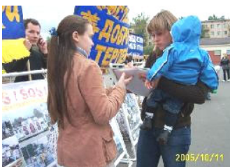
莫斯科人在了解真象

【明慧网 2005 年 9 月 13 日】2005 年 9 月 11 日，俄罗斯法轮功学员在莫斯科街头举行和平请愿，学员们用真人模拟酷刑和百种酷刑图片，向人们展示中共及江氏集团六年来对法轮功迫害的真象。