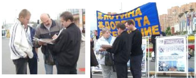
莫斯科人在了解真相，签名呼吁停止迫害

告诉人们在中国，迫害还在继续，只是手段更加隐蔽。俄罗斯学员强烈呼吁停止迫害法轮功。