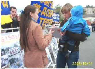
莫斯科人在了解真象

【明慧网 2005 年 9 月 13 日】2005 年 9 月 11 日，俄罗斯法轮功学员在莫斯科街头举行和平请愿，学员们用真人模拟酷刑和百种酷刑图片，向人们展示中共及江氏集团六年来对法轮功迫害的真象。