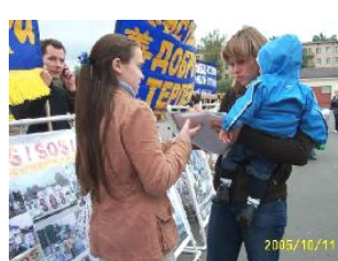
莫斯科人在了解真象

【明慧网】2005 年 9 月 11 日，俄罗斯法轮功学员在莫斯科街头举行和平请愿，学员们用真人模拟酷刑和百种酷刑图片，向人们展示中共及江氏集团六年来对法轮功迫害的真象；告诉人们，在中国迫害还在继续，只是手段更加隐蔽。俄罗斯学员们打出横幅：“请了解正在中国发生的”，“已有 2740 位法轮功学员被迫害致死”，强烈呼吁停止迫害法轮功。