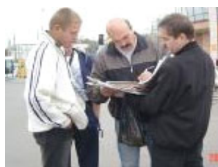
签名呼吁停止迫害