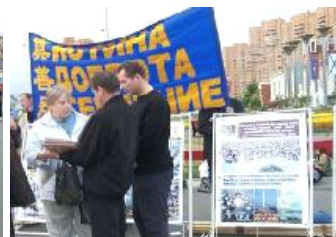
签名呼吁停止迫害