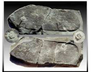
图：踩在三叶虫上的远古脚印