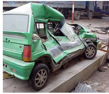
图：车被撞后严重毁坏

神奇的是，在我昏迷的三天中，我经历了很多很多。我时时感到和大法轮在一起，并时而听见法轮转