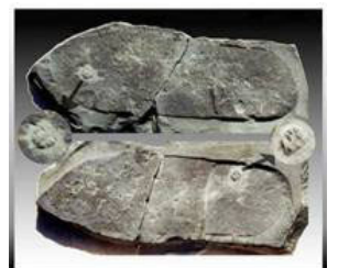
图：踩在三叶虫上的远古脚印