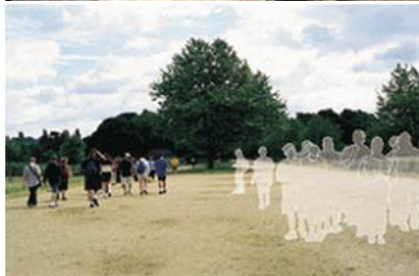
▲多世界理论认为“另一个我”的示意图，2001年9月Discover（《发现》）供图

【明慧网】目前科学主流已经认识到，除了人眼能看到的宇宙之外，还存在数不尽的另外宇宙，而在每一个这样的宇宙空间中，人都有一个身体或者叫“另一个我”（或称“副本”），即人在另外空间有层层身体，就象洋葱一样。另外宇宙空间中充满着丰富多彩的生命和物质形式。