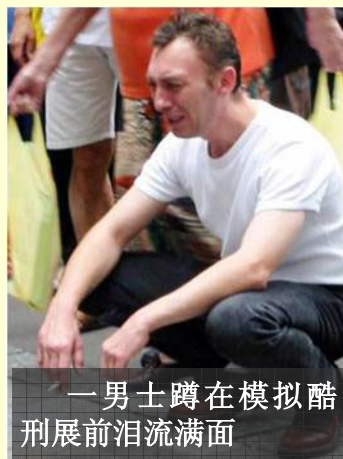
一男士蹲在模拟酷刑展前泪流满面