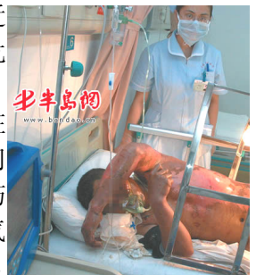
青岛闪电烧伤病人

被闪电击中烧伤的病人在医院接受抢救，病床上方有专门的金属罩，用来把遮盖物与烧伤身体隔开，使烧伤处暴露在空气中晾着。护理人员身穿卫生服，戴口罩以防感染。