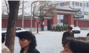
和上访群众隔街相望的是中南海西门（这里可以看到紫禁城的红色围墙）