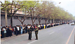
上访学员安静祥和，警察没事闲聊（注意群众身后不是紫禁城红色围墙）