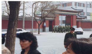
和上访群众隔街相望的是中南海西门（这里可以看到紫禁城的红色围墙）