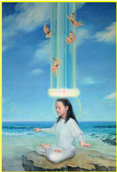
作者：肖平 油画，47in. x69in. (2004)

作者：打坐 对我来讲，是一种享受。虽然有时也腿痛，但那都不算什么，心情放松尽量啥也不想。双腿一盘，被强大的能量包围着，那种宁静祥和真是舒服美妙极了，整个人处在一个很自然放松的状态，是你最美的时刻，一个不需要任何面具的你，一种回家的感觉，因为那是你真正的自己。