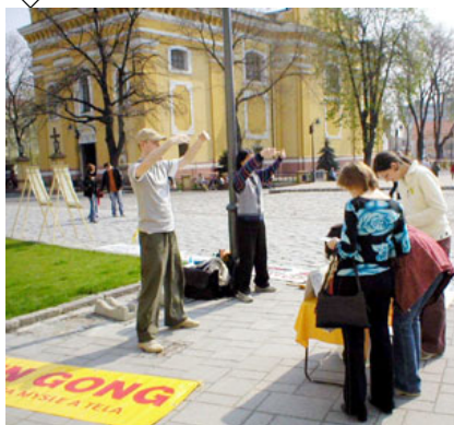
民众签名呼吁终止迫害▲

据斯洛伐克法轮功学员介绍，法轮功最主要的书籍《转法轮》的斯洛伐克语译本，是在2005年3月份出版发行的。