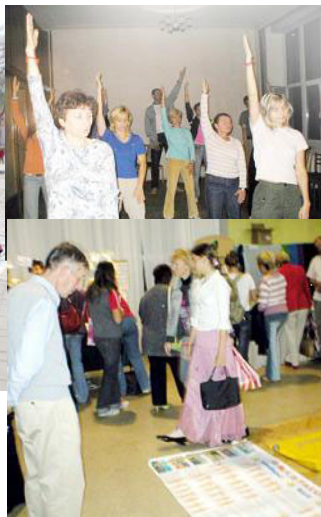
对法轮功感兴趣的民众当场学起功来