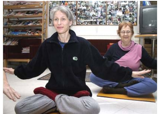
芬兰人在学炼法轮功第五套功法

芬兰Karjalan Heili报于2月23日刊登采访报道和图片。报导说，在芬兰的公园里常可以看到法轮功的踪迹。法轮功在中国曾经非常受欢迎，但是中共在1999年开始镇压法轮功。至今，已有超过2740名法轮功学员被证实因迫害致死。报导还说，气候寒冷时，炼法轮功可以使身体保持温暖。法轮功根据“真、善、忍”法理修炼心性，共有五套动作舒缓的功法，其中四套是动功，第五套则是静功打坐。报导说，法轮功现在已经洪传到70多个国家和地区。