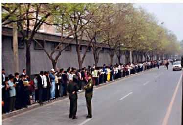
上访学员安静祥和， 警察没事闲聊

答： 1999年4月25日，一万多名法轮功学员到国务院信访办上访，是因为4月23日在天津40多名学员被违法关押，地方政府告知没有北京的