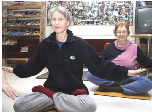
芬兰人在学炼法轮功第五套功法

芬兰Karjalan Heili报于2月23日刊登采访报道和图片。报导说，在芬兰的公园里常可以看到法轮功的踪迹。法轮功在中国曾经非常受欢迎，但是中共在1999年开始镇压法轮功。至今，已有超过2740名法轮功学员被证实因迫害致死。报导还说，气候寒冷时，炼法轮功可以使身体保持温暖。法轮功根据“真、善、忍”法理修炼心性，共有五套动作舒缓的功法，其中四套是动功，第五套则是静功打坐。报导说，法轮功现在已经洪传到70多个国家。◇