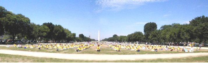
2001年7月20日，美国华盛顿纪念碑前，来自世界各地的大法弟子3000多人集体炼功。

在努力学习着如何去宽容、去原谅、去理解、去付出的过程中，我们体验到了孩童般的无忧和快乐。当我们都按照“真善忍”去规范自己的言行时，身体是如此的健康，生活是如此的和谐和安宁。