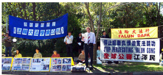
↓ 澳大利亚墨尔本 学员在中领馆前宣读 《法轮大法学会公告》

公告发布后，澳洲、爱尔兰、香港、美国、日本、韩国、法国、泰国、英国等国的各地法轮功学员分别在当地中使馆前宣读了《公告》，呼吁那些依然参与或协助中共、参与迫害法轮功的中共官员或个人，早日醒悟，停止迫害。