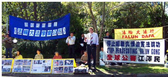
↓ 澳大利亚墨尔本 学员在中领馆前宣读 《法轮大法学会公告》

公告发布后，澳洲、爱尔兰、香港、美国、日本、韩国、法国、泰国、英国等国的各地法轮功学员分别在当地中使馆前宣读了《公告》，呼吁那些依然参与或协助中共、参与迫害法轮功的中共官员或个人，早日醒悟，停止迫害。