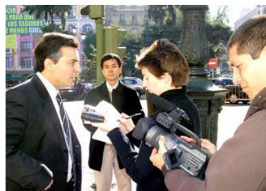
媒体采访伊克雷西亚斯律

辽宁省委书记和辽宁省省长期间，直接参与施行对法轮功学员“群体灭绝”的迫害政策。据不完全统计至少已有333名辽宁法轮功学员被迫害致死，其中包括震惊国际社会的对高蓉蓉电击毁容、虐杀一