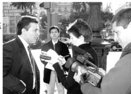
媒体采访伊克雷西亚斯律师

2005 年 11 月 8 日，15 名因修炼法轮功而遭中共迫害的受害者，委托西班牙著名人权律师伊克雷西亚斯，向西班牙国家法院起诉现任中共商业部长薄熙来，指控他因积极参与迫害法轮功，犯有群体灭绝和酷刑罪。