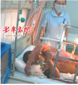
闪电烧伤病人在抢救中

上图中，病床上有专门的玻璃罩（上面盖着白被单，用来遮挡光着的身体）把烧伤身体隔开，使烧伤处暴露在无菌空气中晾着。