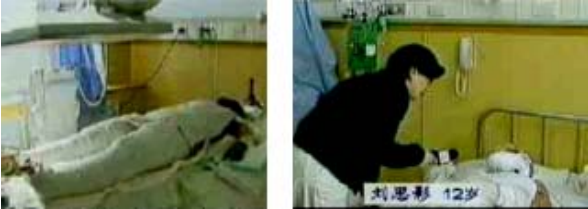
中央台“天安门自焚案”中的“烧伤病人”