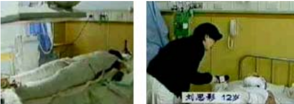
中央台“天安门自焚案”中的“烧伤病人”