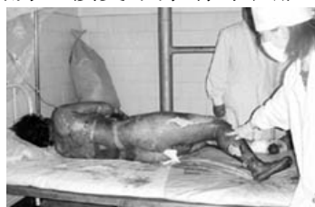
真正的烧伤病人要在空气中晾着，护理人员要穿卫生服，戴口罩防感染。

《伪火》，以其严谨求实的风格和对黑幕的曝光获得第51届哥伦布国际电影电视节荣誉奖。