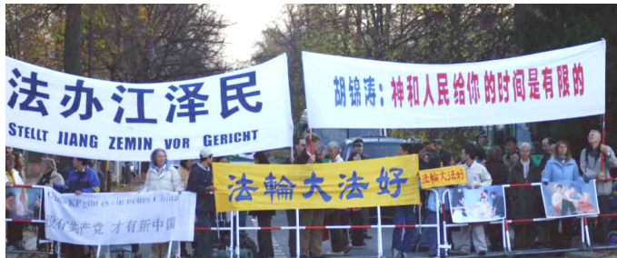
法轮功学员呼吁胡锦涛停止对法轮功的迫害

【明慧网】2005 年 11 月 10 日，胡锦涛抵达柏林展开对德国为期 4 天的访问期间。来自德国、法国、意大利、奥地利、挪威、丹麦、瑞典、瑞士、荷兰的部份法轮功学员聚集柏林呼吁停止迫害。