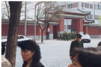
和上访群众隔街相望的是中南海西门（这里可以看到紫禁城的红色围墙）

信访办的位置就在中南海的西门，如果信访办在其它地方，法轮功学员根本就不会去中南海。