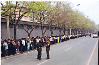
上访学员安静祥和，警察没事闲聊天（注意群众身后不是紫禁城红色围墙）