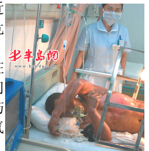
青岛闪电烧伤病人

被闪电击中烧伤的病人在医院接受抢救，病床上方有专门的金属罩，用来把遮盖物与烧伤身体隔开，使烧伤处暴露在空气中晾着。护理人员身穿卫生服，戴口罩以防感染。