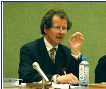
曼夫德·诺瓦可先生

【明慧网】联合国“酷刑问题”特派专员于 12 月 2 日结束了他在中国的两个星期的关于酷刑问题的实地调查，于当日在北京召开新闻发布会，世界各大媒体相应抢播报道。