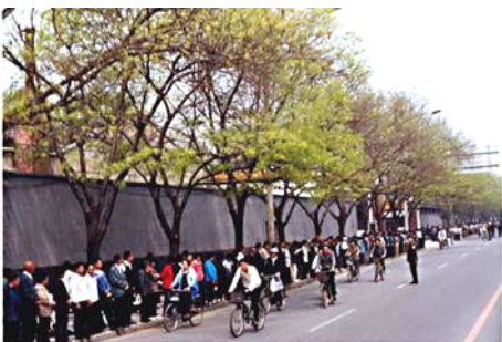
99年4.25万名法轮功学员和平上访

不久的将来，这场惨无人道的迫害就会结束，中国人将不再会因为信仰“真、善、忍”而遭到歧视、迫害和虐杀。那个时候，人们或许会更清楚地意识到法轮功学员们今天抗争的意义，这些捍卫“真、善、忍”信仰的默默无闻的普通民众，才是国家和民族的荣耀，才是这个时代的荣耀。文 / 李致清 ◇