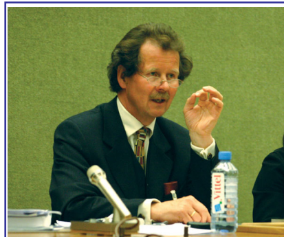
曼夫德·诺瓦可先生

联合国“酷刑问题”特派专员—曼夫德·诺瓦可先生是奥地利的法学教授。在长期收到大量来自中国的酷刑报告和国际社会压力的迫使下，使得这个交涉了十几年的国际一级酷刑问题考察成为现实。这是联合国以及国际社会对中国进行的第一次正式的人权与酷刑问题的实地检查。