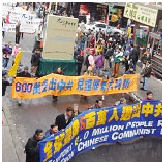
纽约、华埠集会声援六百万民众退党

参加声援活动的法轮功学员表示，传《九评》和声援退党，是要让更多的人了解中共的邪恶本质，制止中共继续迫害法轮功。◇