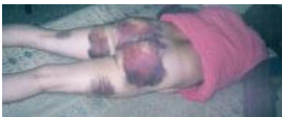
刘季芝被毒打并奸污，臀腿部多处瘀伤

半个多世纪过去了。在人们一遍一遍提醒后人不要忘记当年日军暴行的时候，江泽民一伙和西来邪灵的中