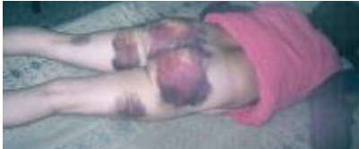
刘季芝被毒打并奸污，臀腿部多处瘀伤

半个多世纪过去了。在人们一遍一遍提醒后人不要忘记当年日军暴行的时候，江泽民一伙和西来邪灵的中