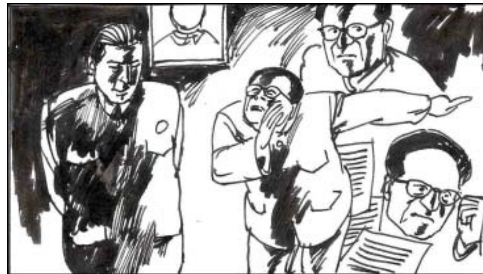
14. 江泽民工作平平，无善可陈，却常常研究《官场现形记》，深刻懂得在中共治下，只有善于钻营、吹牛拍马，才能左右逢源、官运亨通。在历次政治运动中，他造谣诬陷，总是整别人。