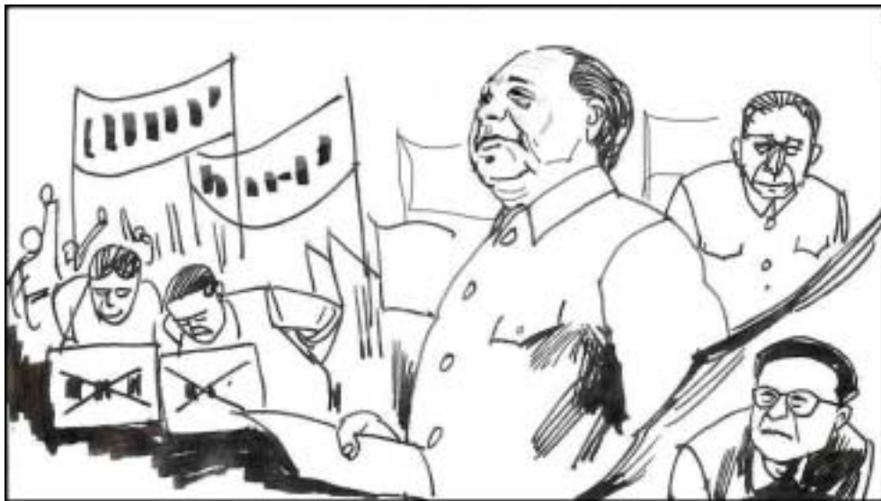
1. 1966 年，江泽民 40 岁，所谓不惑之年。“文化大革命”开始了，毛泽东为了把党内丢失的独裁大权从刘少奇等人手中夺回来。他发动学生和基层工人起来“造反夺权”，一时间几乎所有的“当权派”都被冲击。