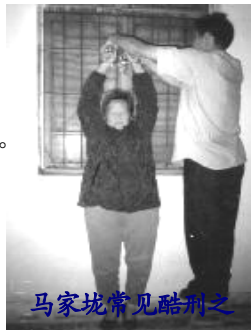
马家垅常见酷刑之一：吊铐(演示图)