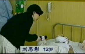
气管切开还能说、唱？记者采访不穿防护服，不戴口罩

包裹，但央视录像上的“烧伤”者却全身包裹严密，不符合基本的医学常识。记者不穿防护服，不