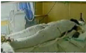
央视《焦点访谈》中的“自焚者”被包裹得严密。