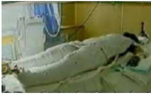
央视《焦点访谈》中的“自焚者”被包裹得严密。