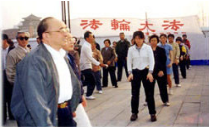
图为 98 年 5 月 15 日伍绍祖亲赴法轮功发祥地长春考察。

1998 年，体总组织北京、武汉、大连及广东省的医学界专家，对近三万五千名法轮功学员所做的五次医学调查表明，修炼法轮功祛病健身的有效率高达 98% 以上。国家体总统计，全国学炼法轮功超过七千多万之众。