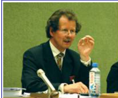
曼夫德·诺瓦可先生

【明慧网】联合国“酷刑问题”特派专员于 12 月 2 日结束了他在中国的两个星期的关于酷刑问题的实地调查，于当日在北京召开新闻发布会，世界各大媒体相应抢播报道。