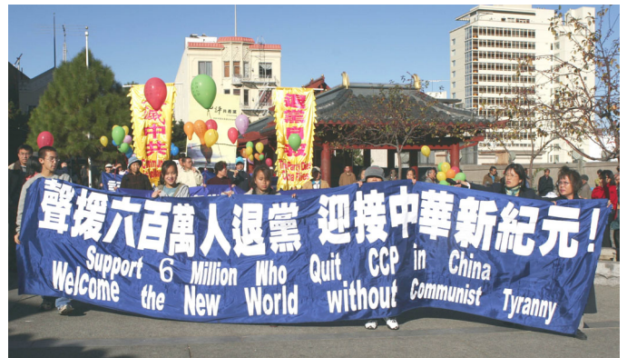
声援 600 万人退出中共。(美国，旧金山)

【大纪元 12 月 4 日讯】日前，海内外民众在大纪元退党网站公开声明退出中共、及其组织的人数已超过 600 万。为声援 600 万人退党，全球各地退党服务中心，于 12 月上旬在当地举办《九评》图片展、集会、以及汽车游行等系列活动。许多民众索要《九评》立刻阅读；有的说，《九评》说的都是事实，是中国的一部近代史，中共的暴虐实在是罄竹难书；有的则表示：“我已经退党了。”还有的说，“没有中共，才有新中国”真是对极了。