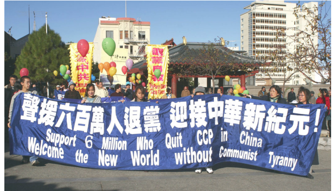
声援 600 万人退出中共。(美国，旧金山)

【大纪元 12 月 4 日讯】日前，海内外民众在大纪元退党网站公开声明退出中共、及其组织的人数已超过 600 万。为声援 600 万人退党，全球各地退党服务中心，于 12 月上旬在当地举办《九评》图片展、集会、以及汽车游行等系列活动。许多民众索要《九评》立刻阅读；有的说，《九评》说的都是事实，是中国的一部近代史，中共的暴虐实在是罄竹难书；有的则表示：“我已经退党了。”还有的说，“没有中共，才有新中国”真是对极了。