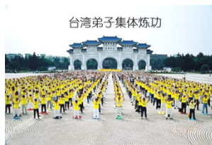
台湾弟子集体炼功

“我想让您知道李老師教导他的学员无私、无畏、无恨，不贪心，不参与政治。他教导学员的只有纯净——真善忍。如果您有机会念一念《转法轮》，您就会自己看到真相。世界上会有谁反对“真善忍”呢？我相信如果您知道真实情况的话，您一定会说一句公道话的。”