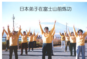
日本弟子在富士山前炼功