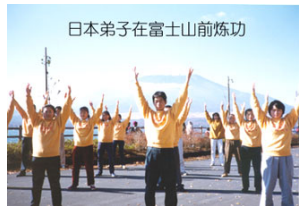
日本弟子在富士山前炼功