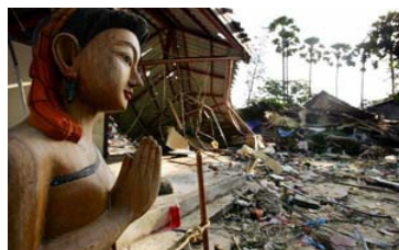
图片 2: 一尊完整的泰国木雕佛像站立在泰国普吉岛被毁坏的潜水商店前。