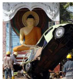
图片 1: 斯里兰卡加勒寺庙前, 佛像在海啸中丝毫无损。

一名斯里兰卡旅馆业者则如此述说他的经验: 虽然方圆数公里内其它东西都被摧毁, 他的旅馆却奇迹般的仅受到轻微伤害。他表示, 这是因他过去十年来行善所积的阴德所致。