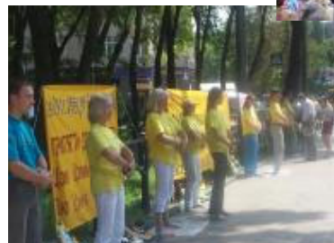
捷克：法轮功学员们在捷克Brno举办的和平请愿活动中征集了很多签名，要求