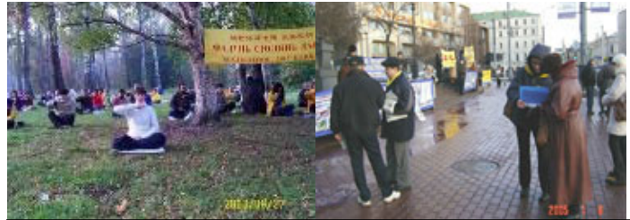
俄罗斯法轮功学员户外炼功，在莫斯科街头讲真象

俄罗斯：法轮功在俄罗斯广泛洪传，从莫斯科、圣彼得堡一直到远东地区都有人修炼法轮功。在街头，在社区，在书展、健康博览会等等场合，常常可见法轮功学员炼功、洪法、讲真象的身影。