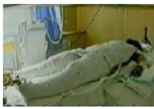
记者未穿防护服,采访无任何防护措施的“烧伤者”