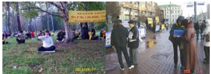
俄罗斯法轮功学员户外炼功，在莫斯科街头讲真象

俄罗斯：法轮功在俄罗斯广泛洪传，从莫斯科、圣彼得堡一直到远东地区都有人修炼法轮功。在街头，在社区，在书展、健康博览会等等场合，常常可见法轮功学员炼功、洪法、讲真象的身影。