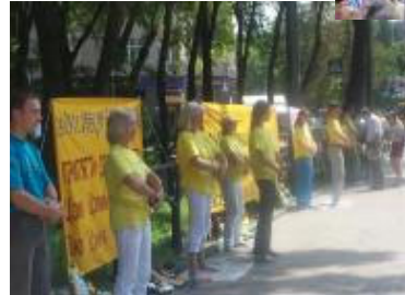
捷克：法轮功学员们在捷克Brno举办的和平请愿活动中征集了很多签名，要求

俄罗斯：法轮功在俄罗斯广泛洪传，从莫斯科、圣彼得堡一直到远东地区都有人修炼法轮功。在街头，在社区，在书展、健康博览会等等场合，常常可见法轮功学员炼功、洪法、讲真象的身影。