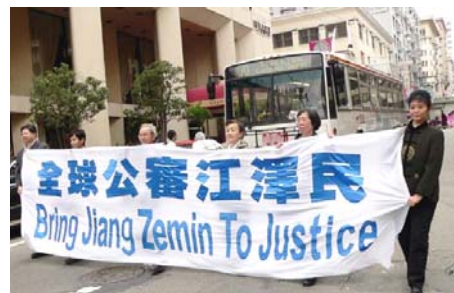
“全球公審江澤民”作為遊行中最令人矚目的方陣之一，表達了無數人的共同心声。

【明慧網】2005 年 2 月 27 日，近兩千名來自世界各地的法輪功學員在舊金山舉行以“正法之路”為主題的盛大遊行。參加遊行的法輪功學員來自美國和加拿大各地，有來自澳洲、台灣、新加坡、韓國等亞洲國家，以及德國、俄羅斯、法國、冰島等歐洲國家。並在舊金山的聯合廣場舉行“以善面對暴力與仇恨”大集會，希望人們關注發生在中國的迫害，共同制止迫害。法輪功學員被迫害的事實引起了社會各界的廣泛關注。美國國會議員、州市議員紛紛到場發言或致詞，要求中共停止迫害。國會議員蘭托斯在致詞中指出，我們將讓中共政權看到，即使面對最黑暗的邪惡，正義終將獲勝。