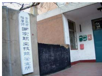
青岛市市北区明霞路34号迫害青岛法轮功学员的洗脑班门口挂着“国家职业技能鉴定所”的招牌，掩人耳目

青岛现在的“法制教育中心”或称“法制教育基地”位于青岛市市北区明霞路34号，（在青岛中心聋校的后门处）门口挂着“青岛市盲人按摩指导中心”、“国家职业技能鉴定所”等招牌，以掩人耳目，其实质是关押迫害青岛法轮功学员的洗脑班，约一万平方米共四楼层房，一天24小时上锁。