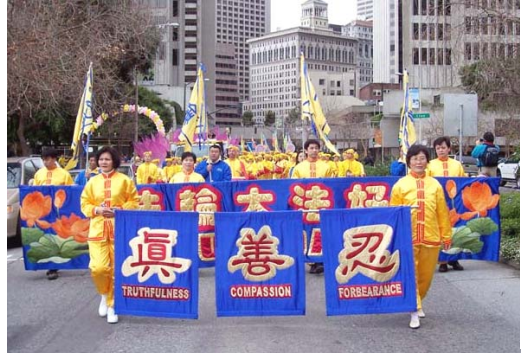
近兩千名來自世界各地的法輪功學員盛大遊行

【明慧網】2005 年 2 月 27 日，近兩千名來自世界各地的法輪功學員在舊金山舉行以“正法之路”為主題的盛大遊行。參加遊行的法輪功學員來自美國和加拿大各地，有來自澳洲、台灣、新加坡、韓國等亞洲國家，以及德國、俄羅斯、法國、冰島等歐洲國家。並在舊金山的聯合廣場舉行“以善面對暴力與仇恨”大集會，希望人們關注發生在中國的迫害，共同制止迫害。法輪功學員被迫害的事實引起了社會各界的廣泛關注。美國國會議員、州市議員紛紛到場發言或致詞，要求中共停止迫害。國會議員蘭托斯在致詞中指出，我們將讓中共政權看到，即使面對最黑暗的邪惡，正義終將獲勝。