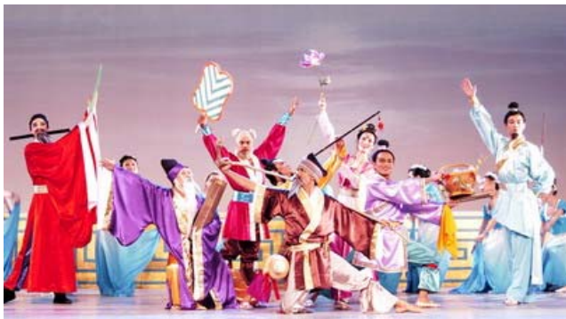
大型舞蹈：“八仙过海”