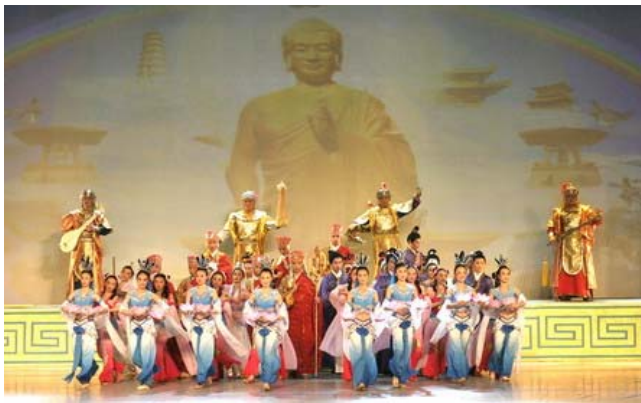
大型舞蹈：佛光普照

《新唐人电视台》于2005年2月4日晚，在纽约麦迪逊花园剧场隆重举办第二届“全球华人新年晚会”。晚会以“神话与传奇”为主题，晚会在旗鼓阵“雷霆天威”的号角和雄浑的鼓阵齐奏中开幕。大型舞蹈“佛光普照”表现了千百年来人们在农历新年祭拜神佛、感谢神佛保佑的传统。表现人们敬拜的虔诚和对祥和的期盼。