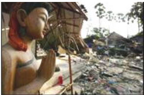
一尊完整的泰国木雕佛像站立在泰国普吉岛一间被毁坏的潜水商店前

【明慧网 2005 年 2 月 8 日】据最新统计，由南亚大海啸所造成的死亡人数已达到 28 万人。 大海啸过后，许多幸存者将自己的大难不死归功于神明显灵。 在泰南普吉岛拉莱海滩旁的一个约二千名居民的小渔村，这里渔民通常每年八月都会举办敬海神仪式，以求海神保佑渔民的平安。这次海啸来袭时，靠着长者的指示，全村都逃过了这场海难，无