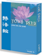
《转法轮》希伯来文版封面

【明慧网】2005 年 2 月下旬，希伯来文《转法轮》的再版本与以色列广大读者见面。